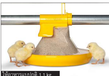
ให้อาหารแบบปกติ 1.1 kg

ระบบจะกระตุ้นความอยากรู้อยากเห็นของลูกไก่และกระตุ้นให้พวกมันหาอาหารสดใหม่ จากการทดลองแสดงให้เห็นว่าน้ำหนักตัวของลูกไก่สูงกว่าปกติถึง 30 กรัมหลังจากสัปดาห์แรกเมื่อใช้ระบบ kick-off