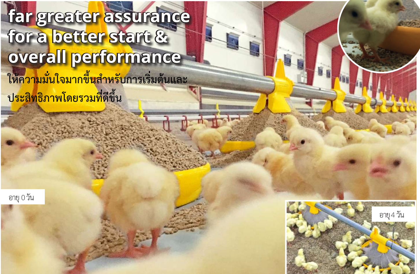
อายุ 0 วัน

ให้ความมั่นใจมากขึ้นสำหรับการเริ่มต้นและ ประสิทธิภาพโดยรวมที่ดีขึ้น