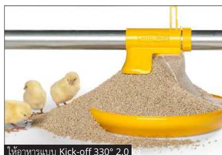
ให้อาหารแบบ Kick-off 330° 2.0 kg