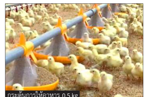
กระตุ้นการให้อาหาร 0.5 kg